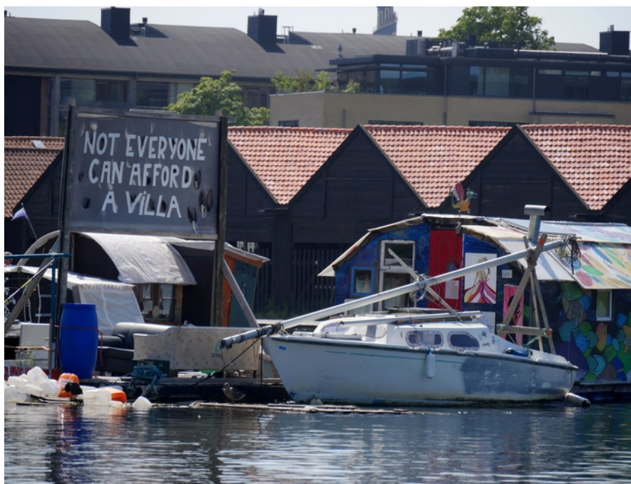
”Not everyone can afford a villa”